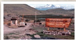
Portería Sarmiento, primera portería del PNTP, 1976

La conformación actual del PNTP se gesta durante un periodo de 20 años, a través de 6 incorporaciones de territorio. El 13 de mayo de 1959, se crea el Parque Nacional de Turismo Lago Grey abarcando 4.332 ha en la ex estancia Pudeto. En 1962 se realiza la primera ampliación aumentando su superficie a 24.532 ha y pasa a denominarse Parque Nacional de Turismo Torres del Paine. En este acto se incluyen el sector comprendido por las montañas circundantes de los valles Ascencio y del Silencio, y además por el territorio situado al occidente del lago Dickson. En 1970 un nuevo decreto amplía en 11.000 ha la superficie del parque, añadiendo por un lado el valle del Francés, incluido su circo glaciar y sus montañas, y por otro el valle del río Perros. El 23 de abril de 1975 una nueva incorporación de terrenos amplía el PNTP a 142.979 ha. En este acto quedan por primera vez incluidos de manera implícita los cuerpos de agua del parque, sin embargo las estancias Cerro Paine y Río Paine permanecen de propiedad privada. Al año siguiente, en 1976, la estancia Río Paine es donada por Guido Monzino aumentando 11.000 ha más de superficie. En 1979 se lleva a cabo el último proceso de ampliación, donde se rectifican sus límites, quedando adentro de éste los lotes 9 y 10, que son los más occidentales del PNTP. En esta nueva ampliación también se rectifican levemente los límites orientales y sur del parque, alcanzando un total de 181.414 ha.