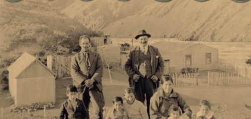
Familia Orozimbo Santos. Estancia Pudeto.