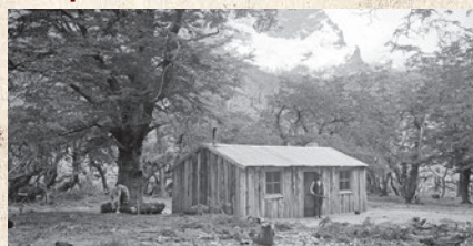
Rancho Capana di Pastori, río Francés.

Existen diversos sitios históricos dentro del PNTP. Estos asentamientos son estancias, puestos, ranchos y campamentos de escaladores. Actualmente quedan pocos, y de varios solo se encuentran vestigios o están en el recuerdo de quienes los conocieron o los escucharon nombrar. Algunos han sido ocupados y reutilizaron por CONAF, otros se desarmaron o quemaron accidentalmente. Se identificaron más de 50 sitios arquitectónicos que dan luces de la intensa actividad desarrollada en el área y el amplio uso que se le daba al territorio.