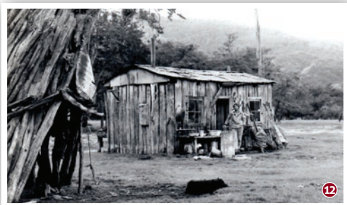
Vista sector Sarmiento.

¿Qué se entiende por memoria histórica? La memoria histórica relaciona los recuerdos y relatos de las personas, que permiten interiorizarnos de la manera en que se experimentó un acontecimiento o cómo fue percibido el medio en el que habitaron. El legado de la memoria constituye un pasado determinado, el cual se puede manifestar tanto de manera tangible como intangible, y se encuentra cruzado con la herencia histórica e identidad de cada persona en la sociedad.