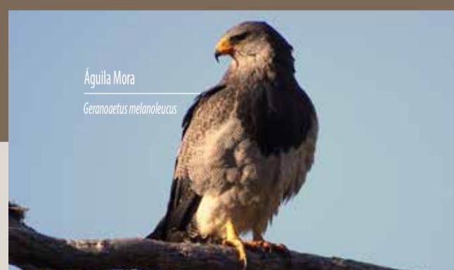
Águila Mora Geranoaetus melanoleucus

La fauna del sector incluye mamíferos como gato montés, zorro gris, puma, chingue y liebre. También podrá observar diversas aves, como águila, pitío, cometocino, cóndor, carpintero negro, golondrina y tucúquere, entre otras.