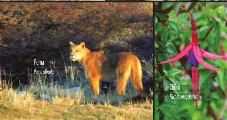
Puma Puma concolor