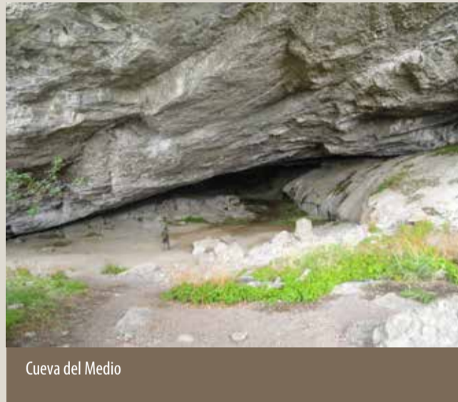
Cueva del Medio