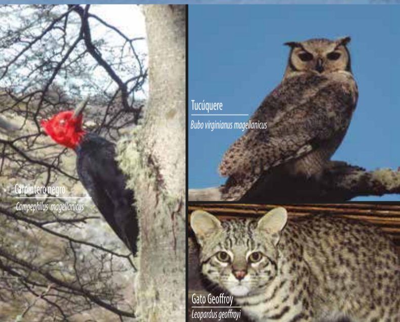
Carpintero negro Campephilus magellanicus