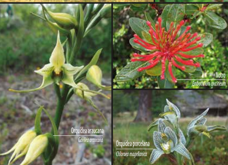
Orquídea araucana Gavilea araucana