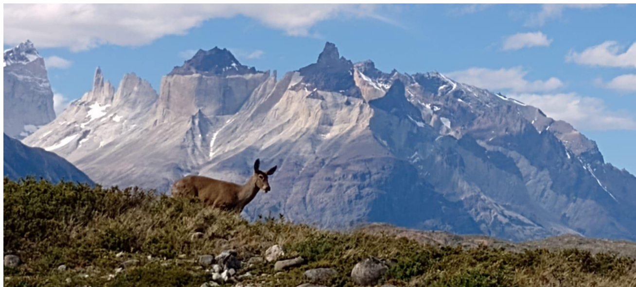
Fotografía: Huemul en sector Pingo (Diciembre de 2022)