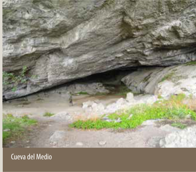
Cueva del Medio