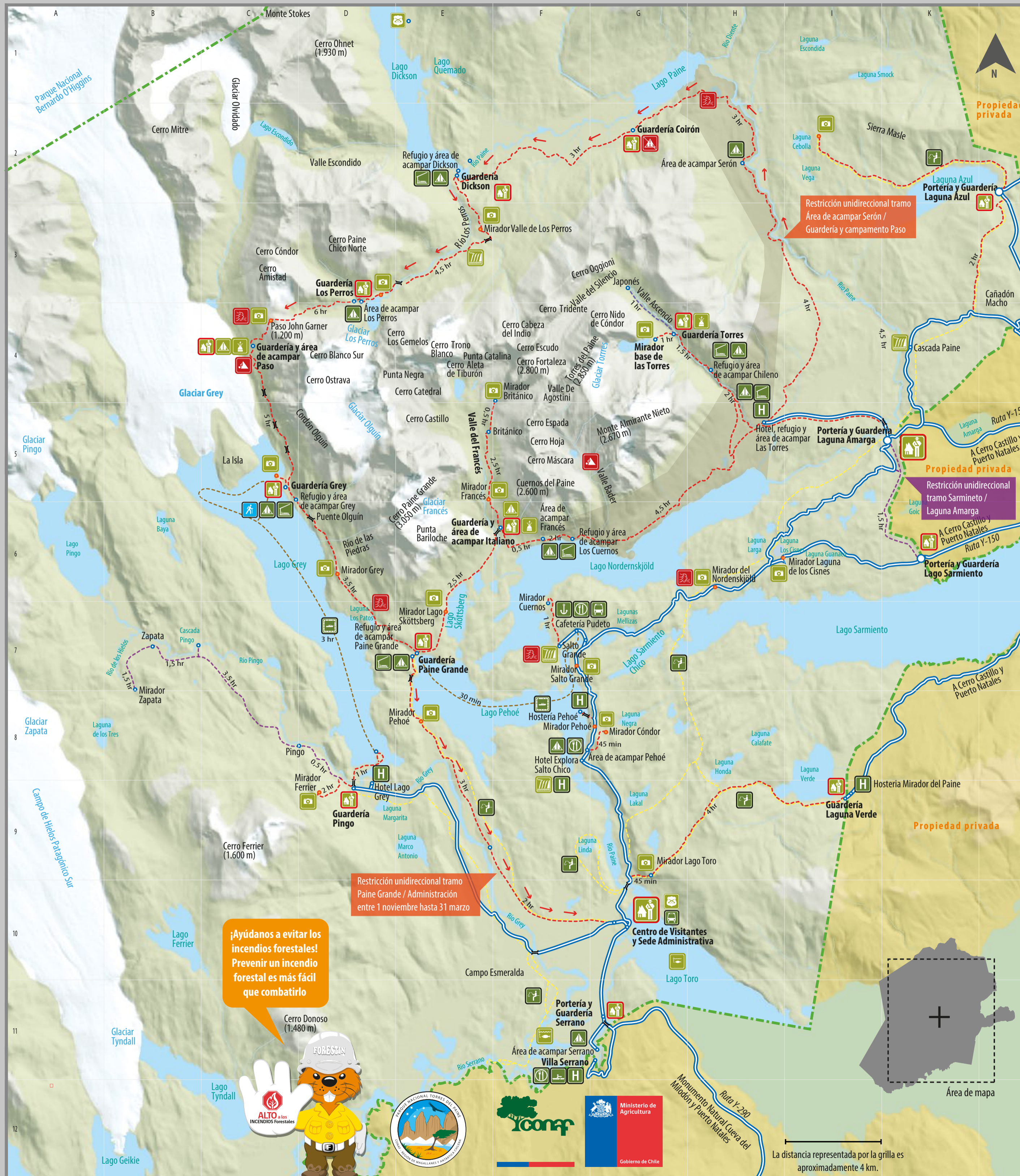
Mapa usado sólo como referencia de orientación turística, sin propiedades cartográficas. En ningún caso intenta definir fronteras o límites territoriales.